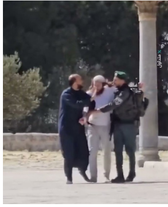
Silsile Kubbesi'ne kesilmiş bir kurban sunmaya çalışan yerleşimcinin tutuklanması