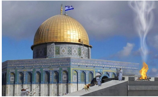
Radikal Arnon Segal'in, Aksa'da kurban kesiminin gerçekleştiği yeri gösteren fotoğrafı

Bu kışkırtmaların yaşandığı bir ortamda, 06 Nisan 2025 tarihinde Tapınak grupları, yerleşimcileri Mescid-i Aksa içinde ve çevresinde Pesah Bayramı kurbanlarını kesmeye başlamaya davet etmiştir 4 . Ertesi gün, İsraili gazeteci Arnon Segal, Siyonist hareketin kurucusu Theodor Herzl'in "Eğer istersen, bu bir hayal değildir" sözünü alıntılıyarak, Aksa'nın sinagoga dönüştürülmesini isteyen kışkırtıcı bir fotoğraf yayınlamıştır 5 .