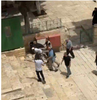
Bir grup yerleşimcinin Mescid-i Aksa'ya baskın düzenlemesi ve Aksa sınırları içine canlı bir kurban sokmaya çalışması