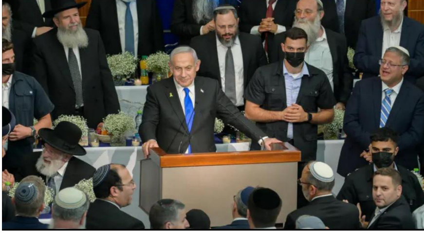
Netanyahu, Harav Merkezi'nde konuşma yaparken

yönelik çabalarının öncüsü olan dini Siyonizm'in fikirleriyle örtüştüğü için, dini Siyonist çevrelerde çok popüler hale gelmiştir 1 .