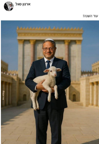
Arnon Segal tarafından yayınlanan, Ben Gvir'i Pesah Bayramı kurbanıyla birlikte gösteren bir yapay zeka görüntüsü

Ben Gvir'in hükûmete dönüşünün, özellikle Yahudilerin Pesah Bayramı'nın yaklaşmasıyla birlikte Tapınak Grupları tarafından kutlanması dikkat çekicidir. Tapınak Gruplarının önde gelen üyelerinden radikal Arnon Segal, işgal hükûmetinin Ulusal Güvenlik Bakanı olan radikal Itamar Ben-Gvir'in Pesah Bayramı kurbanını taşıdığı, yapay zeka tarafından üretilmiş bir görüntü paylaşmıştır 4 .